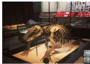
▲島大生が復元した 謎の古生物パレオパラドキシア

第3回目は、 島根大学支援基金から支援 を受けた学生との交流会を 企画します。和菓子を食べながら、 学生の生の声をお聞きください。 同時企画で、島根大学総合博物館ツアー も実施します。化石や骨格標本など、島 大のお宝をツアーコンダクターが解説し ます。島大とその学問について、楽しく 学ぶことができます。 そして最後は学生や学長と記念撮影をし て思い出を共有しましょう！