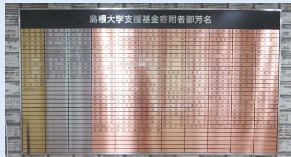
芳名板(島根大学松江キャンパス本部棟1階)