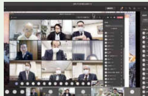
オンライン開催の様子